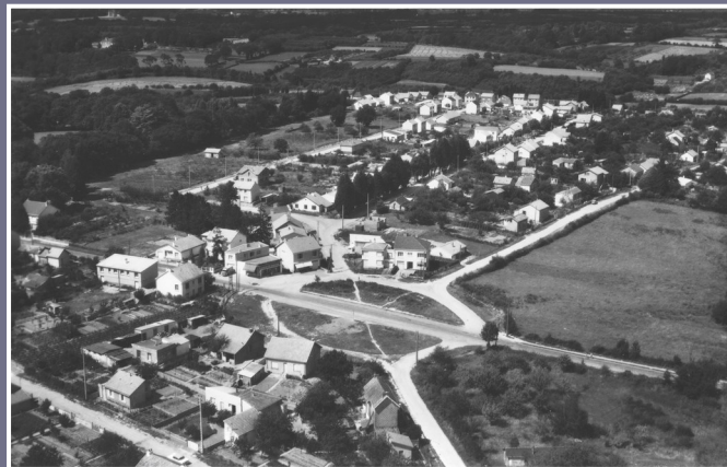
Place d'Auteuil en 1958

Cet ouvrage réalisé par la section Histoire Locale de l'association Culture Loisirs Orvault, vous permettra de découvrir au travers de photos prises sur un même site, hier et aujourd'hui, l'évolution dans la seconde moitié du XXème siècle, d'une commune à l'origine rurale vers une commune urbaine aux portes de Nantes.